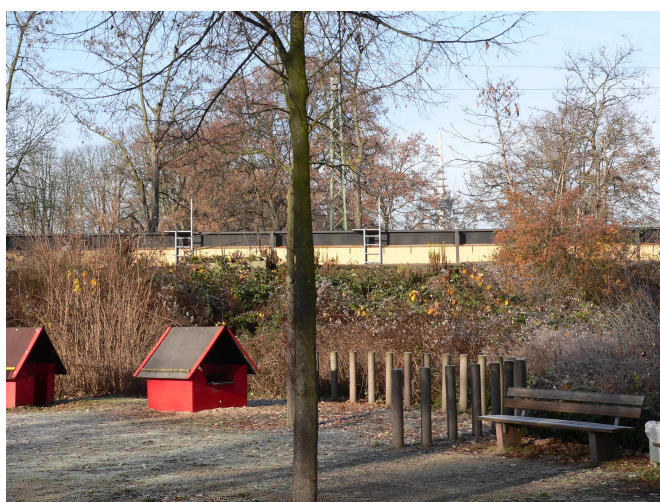
links: Ausschnitt wie oben im Originalzustand

Fundamenthöhe dürfte in Analogie zu Neuhermsheim 0,80-1,20 m betragen, d. h. doppelt so hoch wie abgebildet